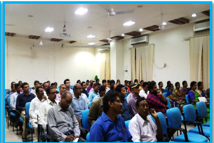
Faculty listening to the lecture