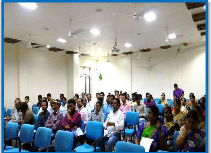
Faculty at the FDP